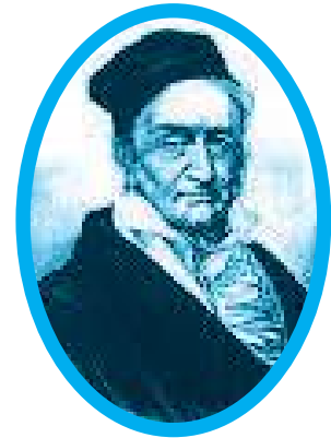
कार्ल फ्रैड्रिक गॉस (1777 – 1855)

अंकगणित की आधारभूत प्रमेय के रूप में विख्यात होने से पहले, प्रमेय 1.2 का संभवतया सर्वप्रथम वर्णन यूक्लिड के एलीमेंट्स की पुस्तक IX में साध्य (proposition) 14 के रूप में हुआ था। परंतु इसकी सबसे पहले सही उपपत्ति कार्ल फ्रैड्रिक गॉस (Carl Friedrich Gauss) ने अपनी कृति डिसक्विशंस अरिथिमेटिकी (Disquisitiones Arithmeticae) में दी। कार्ल फ्रैड्रिक गॉस को प्रायः 'गणितज्ञों का राजकुमार' कहा जाता है तथा उनका नाम सभी समयकालों के तीन महानतम गणितज्ञों में लिया जाता है, जिनमें आर्किमिडीज़ (Archimedes) और न्यूटन (Newton) भी सम्मिलित हैं। उनका गणित और विज्ञान दोनों में मौलिक योगदान है।