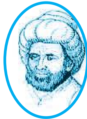
मुहम्मद इब्न मूसा अल-ख्वारिज़्मी (780 – 850 सा.यु.)

प्रमेयिका एक सिद्ध किया हुआ कथन होता है और इसे एक अन्य कथन को सिद्ध करने में प्रयोग करते हैं।