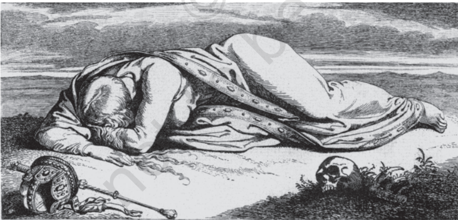
चित्र 18 - 'द फॉलेन जर्मनिया' (हताश जर्मनिया), जूलियस ह्यूबनर, 1850