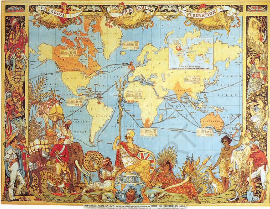
चित्र 20 - ब्रिटिश साम्राज्य का यशगान करता एक मानचित्र।

सबसे ऊपर फ़रिश्ते स्वतंत्रता का बैनर थामे दिखायी देते हैं। अग्रभाग में ब्रिटिश राष्ट्र का प्रतीक—ब्रितानिया—विजयभाव के साथ भूमंडल के ऊपर बैठा है। उपनिवेशों को शेर, हाथी, वन और आदिम समुदायों की छवियों के जरिए दर्शाया गया है। दुनिया पर प्रभुत्व को ब्रिटिश राष्ट्रीय गौरव का विषय बताया गया है।