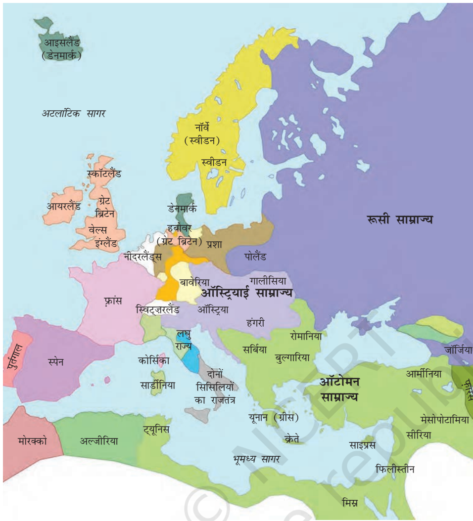
चित्र 3 – वियना कांग्रेस 1815 के बाद का यूरोप।

किया था। मगर प्रशासनिक क्षेत्र में उसने क्रांतिकारी सिद्धांतों का समावेश किया था ताकि पूरी व्यवस्था अधिक तर्कसंगत और कुशल बन सके। 1804 की नागरिक संहिता जिसे आमतौर पर नेपोलियन की संहिता के नाम से जाना जाता है, ने जन्म पर आधारित विशेषाधिकार समाप्त कर दिए थे। उसने क़ानून के समक्ष बराबरी और संपत्ति के अधिकार को सुरक्षित बनाया। इस संहिता को फ़्रांसीसी नियंत्रण के अधीन क्षेत्रों में भी लागू किया गया। डच गणतंत्र, स्विट्ज़रलैंड, इटली और जर्मनी में नेपोलियन ने प्रशासनिक विभाजनों को सरल बनाया, सामंती व्यवस्था को खत्म किया और किसानों को भू-दासत्व और जागीरदारी शुल्कों से मुक्ति दिलाई। शहरों में भी कारीगरों के श्रेणी-संघों के नियंत्रणों को हटा दिया गया। यातायात और संचार-व्यवस्थाओं को सुधारा गया। किसानों, कारीगरों, मजदूरों और नए उद्योगपतियों ने नयी-नयी मिली आज़ादी चखी। उद्योगपतियों और ख़ासतौर पर समान बनाने वाले लघु उत्पादक यह समझने लगे कि एकसमान क़ानून,