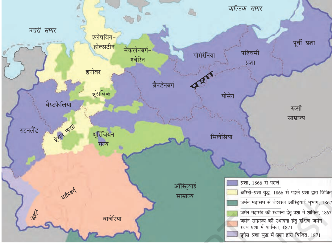
चित्र 12 - जर्मनी का एकीकरण (1866-71)।

था। उन्नीसवीं सदी के मध्य में इटली सात राज्यों में बँटा हुआ था जिनमें से केवल एक—सार्डिनिया पीडमॉण्ट में एक इतालवी राजघराने का शासन था। उत्तरी भाग ऑस्ट्रियाई हैब्सबर्गों के अधीन था, मध्य इलाकों पर पोप का शासन था और दक्षिणी क्षेत्र स्पेन के बूर्बों राजाओं के अधीन थे। इतालवी भाषा ने भी साझा रूप हासिल नहीं किया था और अभी तक उसके विविध क्षेत्रीय और स्थानीय रूप मौजूद थे।