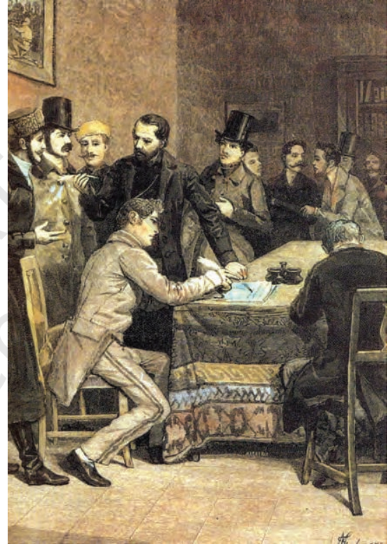
चित्र 7 - ज्युसेपे मेत्सिनी और बर्न 1833 में 'यंग यूरोप' की स्थापना। गिआकोमो मांतेगाज़ा का चित्र।

ऐसा ही वह व्यक्ति था इटली का क्रांतिकारी ज्युसेपी मेत्सिनी। उनका जन्म 1807 में जेनोआ में हुआ था और वह कार्बोनारी के गुप्त संगठन का सदस्य बन गया। चौबीस साल की युवावस्था में लिगुरिया में क्रांति करने के लिए उसे बहिष्कृत कर दिया गया। तत्पश्चात उसने दो और भूमिगत संगठनों की स्थापना की। पहला था मार्सेई में यंग इटली और दूसरा बर्न में यंग यूरोप, जिसके सदस्य पोलैंड, फ़्रांस, इटली और जर्मन राज्यों में समान विचार रखने वाले युवा थे। मेत्सिनी का विश्वास था कि ईश्वर की मर्जी के अनुसार राष्ट्र ही मनुष्यों की प्राकृतिक इकाई थी। अतः इटली छोटे राज्यों और प्रदेशों के पैबंदों की तरह नहीं रह सकता था। उसे जोड़ कर राष्ट्रों के व्यापक गठबंधन के अंदर एकीकृत गणतंत्र बनाना ही था। यह एकीकरण ही इटली की मुक्ति का आधार हो सकता था। उसके इस मॉडल की देखा-देखी जर्मनी, फ़्रांस, स्विट्ज़रलैंड और पोलैंड में गुप्त संगठन कायम किए गए। मेत्सिनी द्वारा राजतंत्र का घोर विरोध करके और प्रजातांत्रिक गणतंत्रों के अपने स्वप्न से मेत्सिनी ने रूढ़िवादियों को हरा दिया। मैटरनिख ने उसे 'हमारी सामाजिक व्यवस्था का सबसे खतरनाक दुश्मन' बताया।