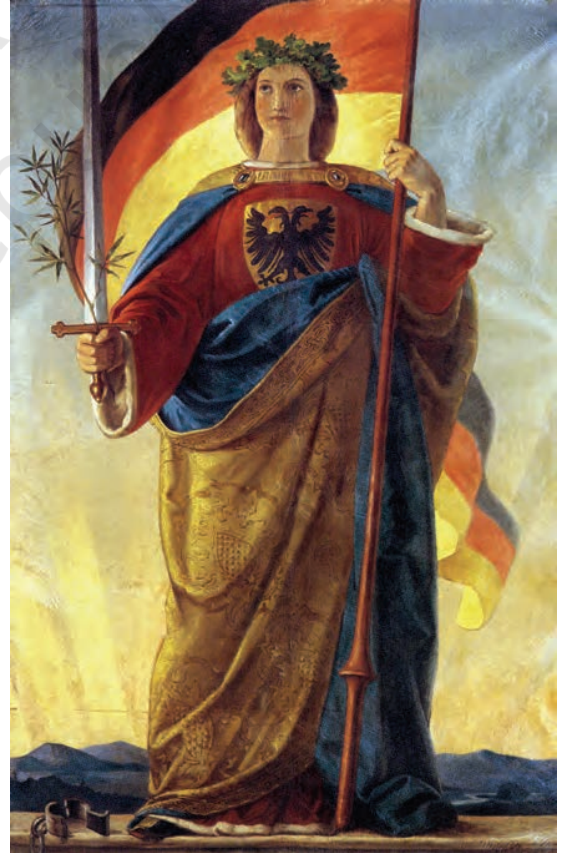
चित्र 17 - जर्मनिया, चित्रकार फ़िलिप वेट, 1848

इसमें मारीआन की तसवीर बनाई गई है जो फ्रांसीसी गणराज्य का प्रतिनिधित्व करती है।