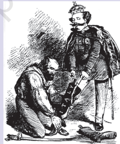
चित्र 15 - गैरीबॉल्डी, सार्डीनिया-पीडमॉण्ट के राजा विक्टर इमेनुएल II को इटली नामक बूट (जूता) पहनने में मदद करते हुए। 1859 का अंग्रेज़ी व्यंग्य चित्र।

1867 में गैरीबॉल्डी के नेतृत्व में स्वयंसेवकों की एक सेना पेपल राज्यों से लड़ने रोम गई जो इटली के एकीकरण में अंतिम बाधा थी। वहाँ एक फ्रांसीसी सैनिक टुकड़ी तैनात थी। 'रेड शर्ट्स' फ्रांसीसी और पेपल सैनिकों के सामने टिक नहीं पाए। 1870 में जब प्रशा से युद्ध के दौरान फ्रांस ने रोम से अपने सैनिक हटा लिए तब जाकर पेपल राज्य अंततः इटली में सम्मिलित हुए।