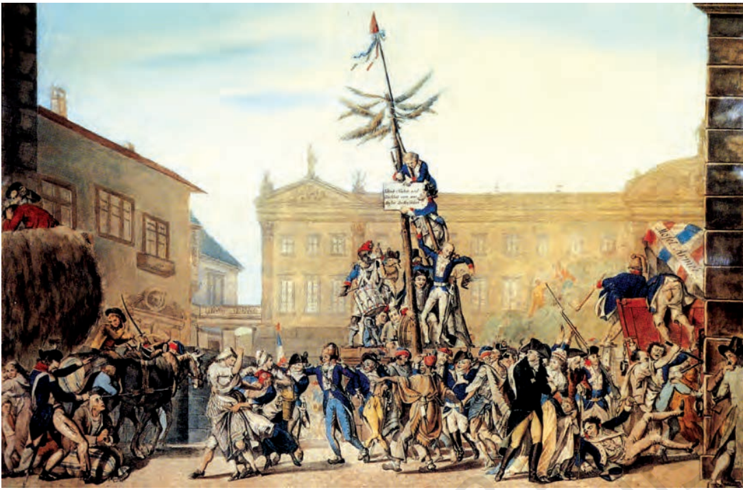
चित्र 4 - ज्वेब्रकेन, जर्मनी में, स्वतंत्रता के वृक्ष का रोपण।