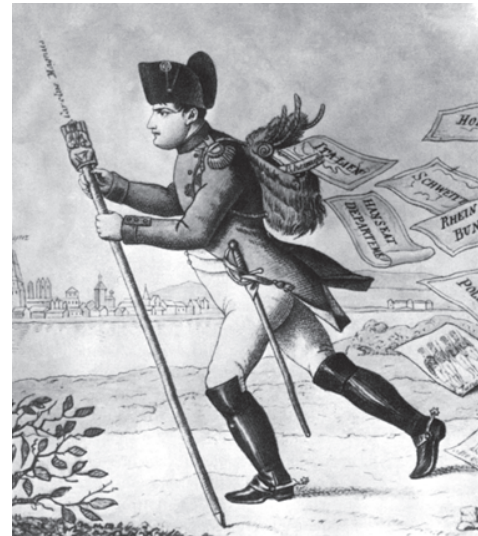
चित्र 5 - राइनलैंड का डाकिया लाइप्सिग से आते हुए सब कुछ गँवा देता है।

लेकिन जीते हुए इलाकों में स्थानीय लोगों की फ्रांसीसी शासन के प्रति मिली-जुली प्रतिक्रियाएँ थीं। शुरुआत में अनेक स्थानों जैसे हॉलैंड और स्विट्ज़रलैंड और साथ ही कई शहरों जैसे - ब्रसेल्स, मेंज़, मिलान और वॉरसा में फ्रांसीसी सेनाओं का स्वतंत्रता का तोहफ़ा देने वालों की तरह स्वागत किया गया। मगर यह शुरुआती उत्साह शीघ्र ही दुश्मनी में बदल गया जब यह साफ़ होने लगा कि नयी प्रशासनिक व्यवस्थाएँ राजनीतिक स्वतंत्रता के अनुरूप नहीं थीं। बढ़े हुए कर, सेंसरशिप और बाक़ी यूरोप को जीतने के लिए फ्रेंच सेना में जबरन भर्ती से हो रहे नुकसान प्रशासनिक परिवर्तनों से मिले फ़ायदों से कहीं ज़्यादा नज़र आने लगे।