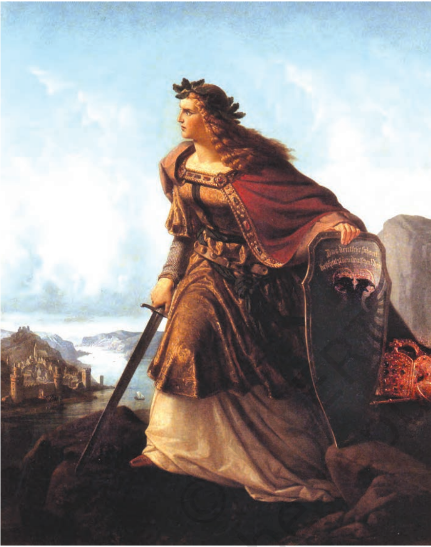
चित्र 19 - जर्मनिया गार्डिंग द राइन ( राइन नदी पर पहरा देती जर्मनिया )। 1860 में चित्रकार लॉरेन्ज़ क्लासेन को यह चित्र बनाने का काम सौंपा गया। जर्मनिया की तलवार पर खुदा हुआ है : 'जर्मन तलवार जर्मन राइन की रक्षा करती है'