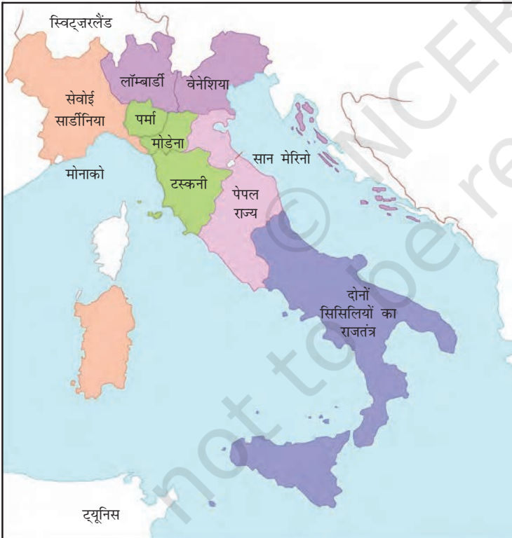
चित्र 14 (क) – एकीकरण से पूर्व इटली के राज्य, 1858

कुछ विद्वानों ने तर्क दिया है कि राष्ट्र या राष्ट्र-राज्य का मॉडल या आदर्श ग्रेट ब्रिटेन है। ब्रिटेन में राष्ट्र-राज्य का निर्माण अचानक हुई कोई उथल-पुथल या क्रांति का परिणाम नहीं था। यह एक लंबी चलने वाली प्रक्रिया का