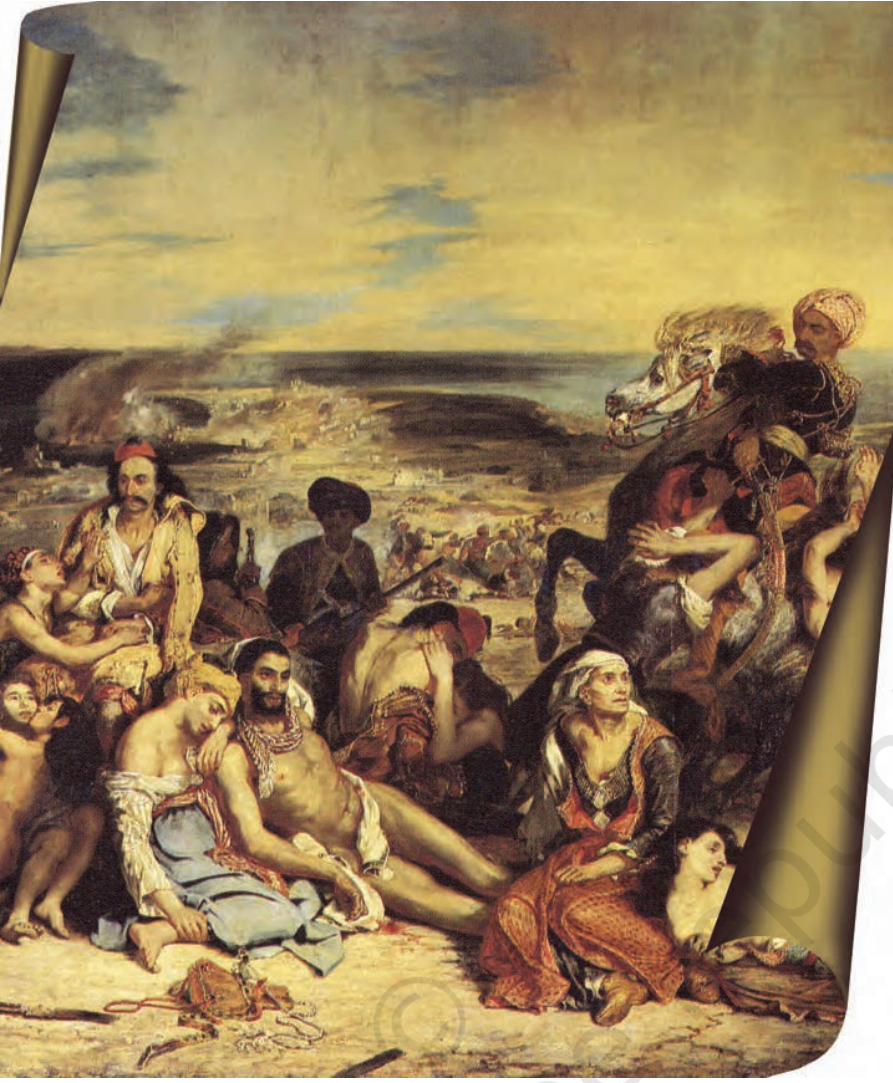
चित्र 8 - यूजीन देलाक्रोआ, द मसैकर ऐट किऑस, 1824

फ्रांसीसी चित्रकार देलाक्रोआ सबसे महत्वपूर्ण फ्रेंच रूमानी चित्रकारों में से एक था। यह विशाल चित्र (4.19 मीटर × 3.54 मीटर) एक घटना को चित्रित करता है जिसमें किऑस द्वीप पर कहा जाता है तुर्कों ने बीस हजार यूनानियों को मार डाला। देलाक्रोआ ने घटना नाटकीय बना कर, महिलाओं और बच्चों की पीड़ा को केंद्र बिंदु बनाते हुए चटख रंगों का प्रयोग करके देखने वालों की भावनाएँ उभार करके यूनानियों के लिए सहानुभूति जगाने की कोशिश की।