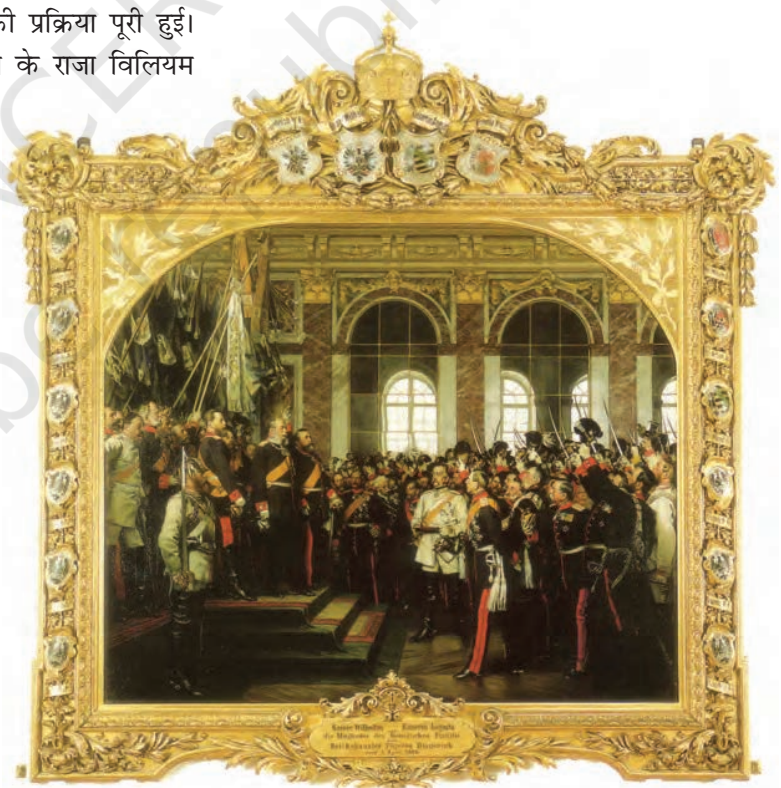
चित्र 11 - आन्तॉन वॉन वर्नर की कृति, वर्साय के हॉल ऑफ़ मिरर्स में जर्मन साम्राज्य की घोषणा।

जर्मनी की तरह इटली में भी राजनीतिक विखंडन का एक लंबा इतिहास था। इटली अनेक वंशानुगत राज्यों तथा बहु-राष्ट्रीय हैब्सबर्ग साम्राज्य में बिखरा हुआ