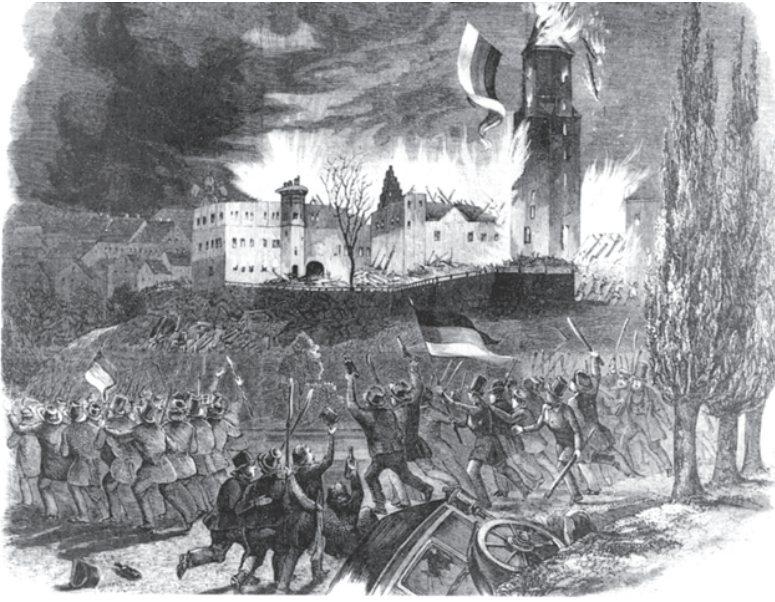
चित्र 9 - कृषक विद्रोह, 1848

1848 ऐसा ही एक वर्ष था। खाने-पीने की कमी और व्यापक बेरोज़गारी से पेरिस के लोग सड़कों पर उतर आए। जगह-जगह अवरोध लगाए गए और लुई फ़िलिप को भागने पर मजबूर किया गया। राष्ट्रीय सभा (National Assembly) ने एक गणतंत्र की घोषणा करते हुए 21 वर्ष से ऊपर सभी वयस्क पुरुषों को मताधिकार प्रदान किया और काम के अधिकार की गारंटी दी। रोज़गार उपलब्ध कराने के लिए राष्ट्रीय कारखाने स्थापित किए गए।