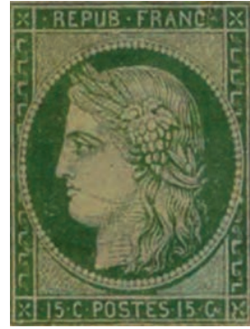
चित्र 16 - 1850 का डाक टिकट।

इसी प्रकार के नारी रूपकों का आविष्कार कलाकारों ने उन्नीसवीं सदी में किया। फ्रांस में उसे लोकप्रिय ईसाई नाम मारीआन दिया गया जिसने जन-राष्ट्र के विचार को रेखांकित किया। उसके चिह्न भी स्वतंत्रता और गणतंत्र के थे – लाल टोपी, तिरंगा और कलगी। मारीआन की प्रतिमाएँ सार्वजनिक चौकों पर लगाई गईं ताकि जनता को एकता के राष्ट्रीय प्रतीक की याद आती रहे और लोग उससे तादात्म्य स्थापित कर सकें। मारीआन की छवि सिक्कों और डाक टिकटों पर अंकित की गई। इसी तरह जर्मनिया, जर्मन राष्ट्र का रूपक बन गई। चाक्षुष अभिव्यक्तियों में जर्मनिया बलूत वृक्ष के पत्तों का मुकुट पहनती है क्योंकि जर्मन बलूत वीरता का प्रतीक है।