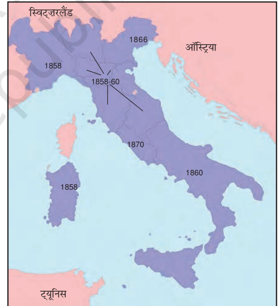
चित्र 14 (ख) – एकीकरण के बाद इटली। नक्शे में एकीकृत राज्यों के वर्षों को दर्शाया गया है।

चित्र 14 (ख) की जाँच करें। कौन सा क्षेत्र सबसे पहले एकीकृत इटली का हिस्सा बना? सबसे आखिर में कौन सा क्षेत्र शामिल हुआ? किस साल सबसे ज्यादा राज्य एकीकृत इटली में शामिल हुए?