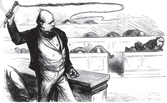
चित्र 13 - व्यंग्यचित्र : जर्मन राइखस्टैग (संसद) में ऑटो वॉन बिस्मार्क, फ़िगारो से, वियना, 5 मार्च 1870

1830 के दशक में ज्युसेपे मेत्सिनी ने एकीकृत इतालवी गणराज्य के लिए एक सुविचारित कार्यक्रम प्रस्तुत करने की कोशिश की थी। उसने अपने उद्देश्यों के प्रसार के लिए यंग इटली नामक एक गुप्त संगठन भी बनाया था। 1831 और 1848 में क्रांतिकारी विद्रोहों की असफलता से युद्ध के ज़रिये इतालवी राज्यों को जोड़ने की जिम्मेदारी सार्डिनिया-पीडमॉण्ट के शासक विक्टर इमैनुएल द्वितीय पर आ गई। इस क्षेत्र के शासक अभिजात वर्ग की नज़रों में एकीकृत इटली उनके लिए आर्थिक विकास और राजनीतिक प्रभुत्व की संभावनाएँ उत्पन्न करता था। मंत्री प्रमुख कावूर, जिसने इटली के प्रदेशों को एकीकृत करने वाले आंदोलन का नेतृत्व किया, न तो एक क्रांतिकारी था और न ही जनतंत्र में विश्वास रखने वाला। इतालवी अभिजात वर्ग के तमाम अमीर और शिक्षित सदस्यों की तरह वह इतालवी भाषा से कहीं बेहतर फ्रेंच बोलता था। फ्रांस से सार्डिनिया-पीडमॉण्ट की एक चतुर कूटनीतिक संधि, जिसके पीछे कावूर का हाथ था, से सार्डिनिया-पीडमॉण्ट 1859 में ऑस्ट्रियाई बलों को हरा पाने में कामयाब